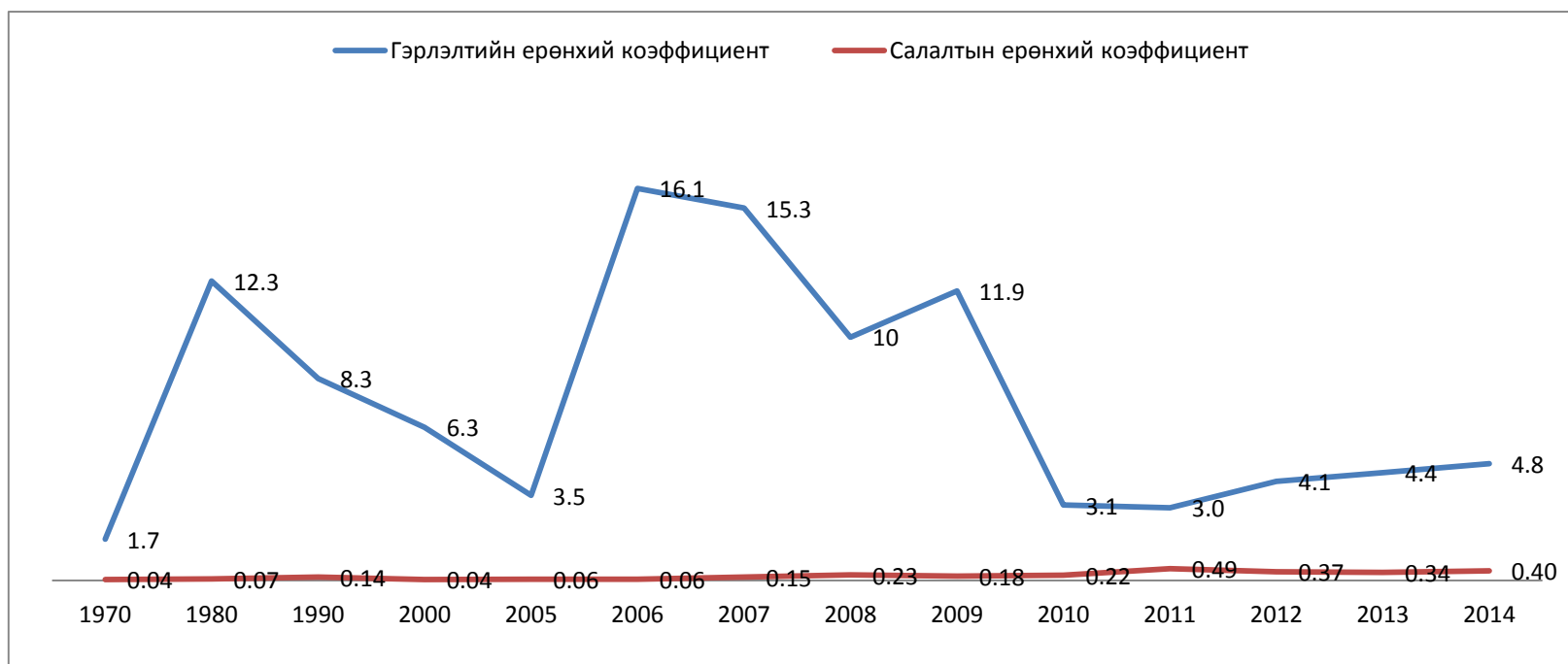
Зураг 3.8 Гэрлэлт, цуцлалт, 1000 хүн тутамд, 1970-2014 он